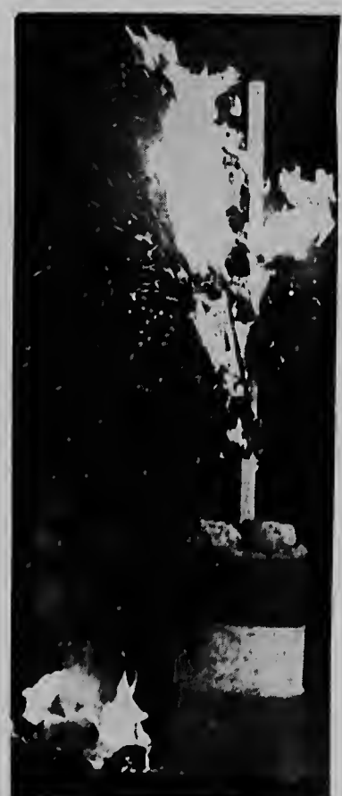
Diamars anochi carnaval di Aruba a ser clausura oficialmente cu e kimamento di Rey Momo riba Juancho Irausquin Plein. Prome cu e kimamento, un "Old-Mask Parade" a tuma lugar den cayanan di Oranjestad riba musica di diferente steelband. E foto ta muestra e momento cu e vlamnan di candela tabata absorbe e culpa di Rey Momo.

ORANJESTAD - Diarazon atardi pa cuat'or un auto di familia a core dal contra di e palu cu ta sirbi pa sostene un palu di luz net dilan i di oficina di duane. E danjo material ta 700 florin. E chauffeur a declara na poliznan cu e kier a cende un sigaria net na e momento ey y e auto a desvia bai riba e palu.